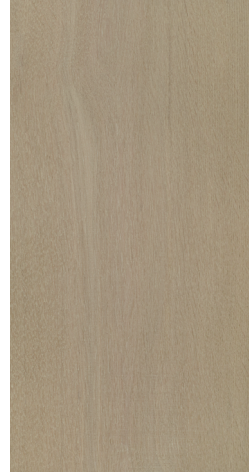
0703 Faded Pebble