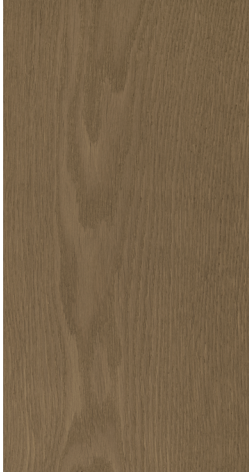
0701 Soft Umber