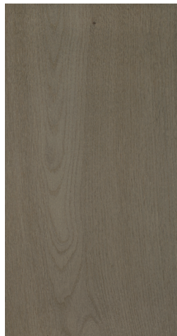
0706 Intense Taupe