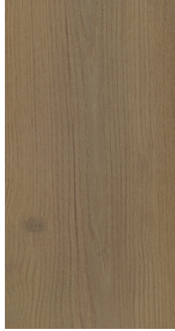
0702 Medium Shell