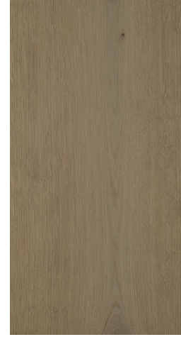
0704 Medium Clay