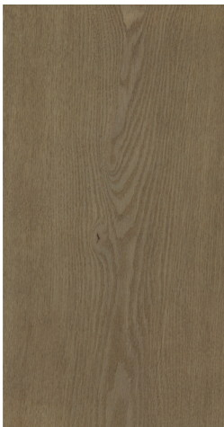
0705 Light Clay