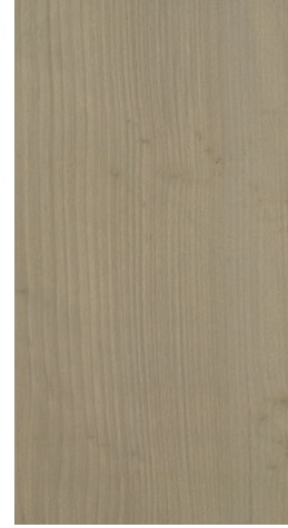
BQ P604 Warm Smoke