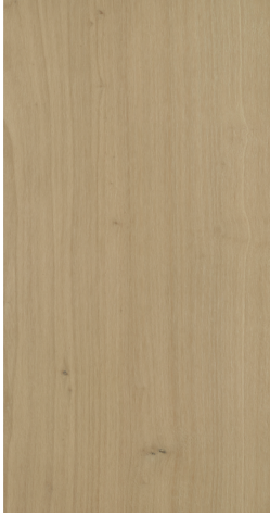
BQ P601 Warm Sand