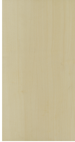
BQ P602 Dusty Carbon