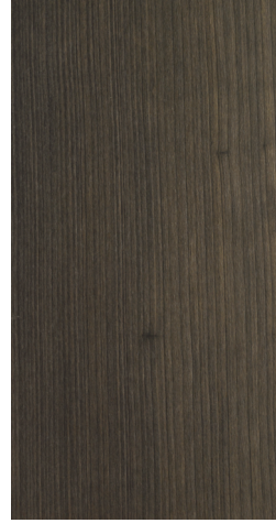
BQ P603 Dark Charcoal