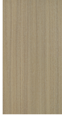
BQ M504 Smokey Beige