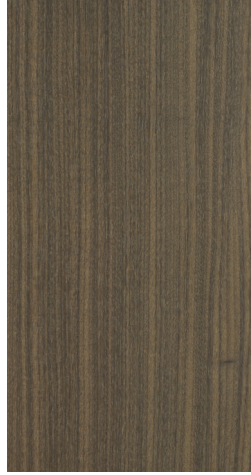
BQ M502 Muted Bark