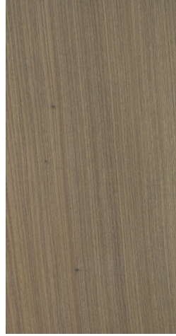
BQ M503 Warm Taupe